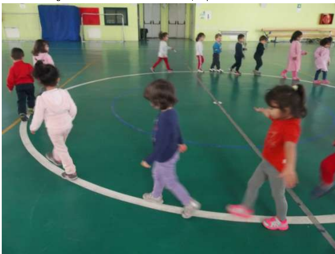
Sperimentiamo i diversi modi di camminare