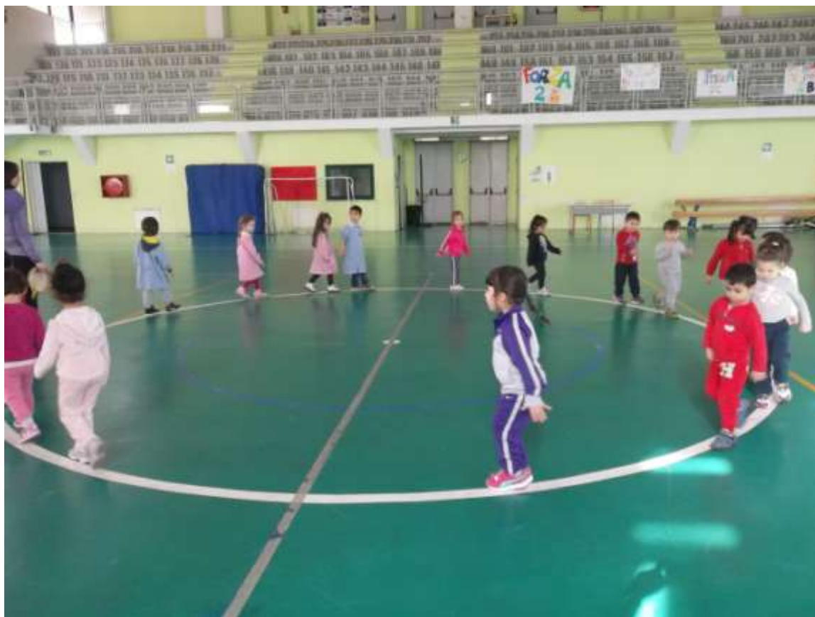
Camminiamo seguendo il ritmo alternando movimento/stop