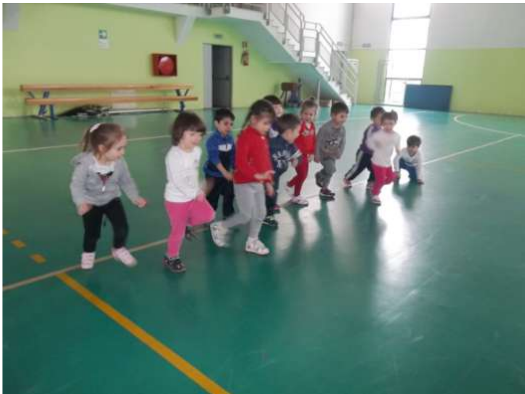
Corriamo da una parte all'altra della palestra cercando di mantenere la direzione