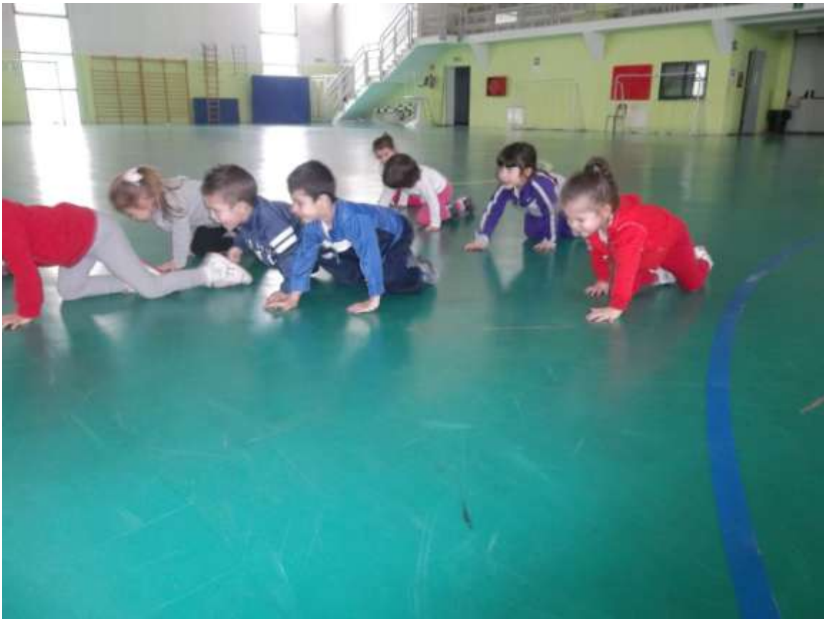
Il gioco delle scatoline