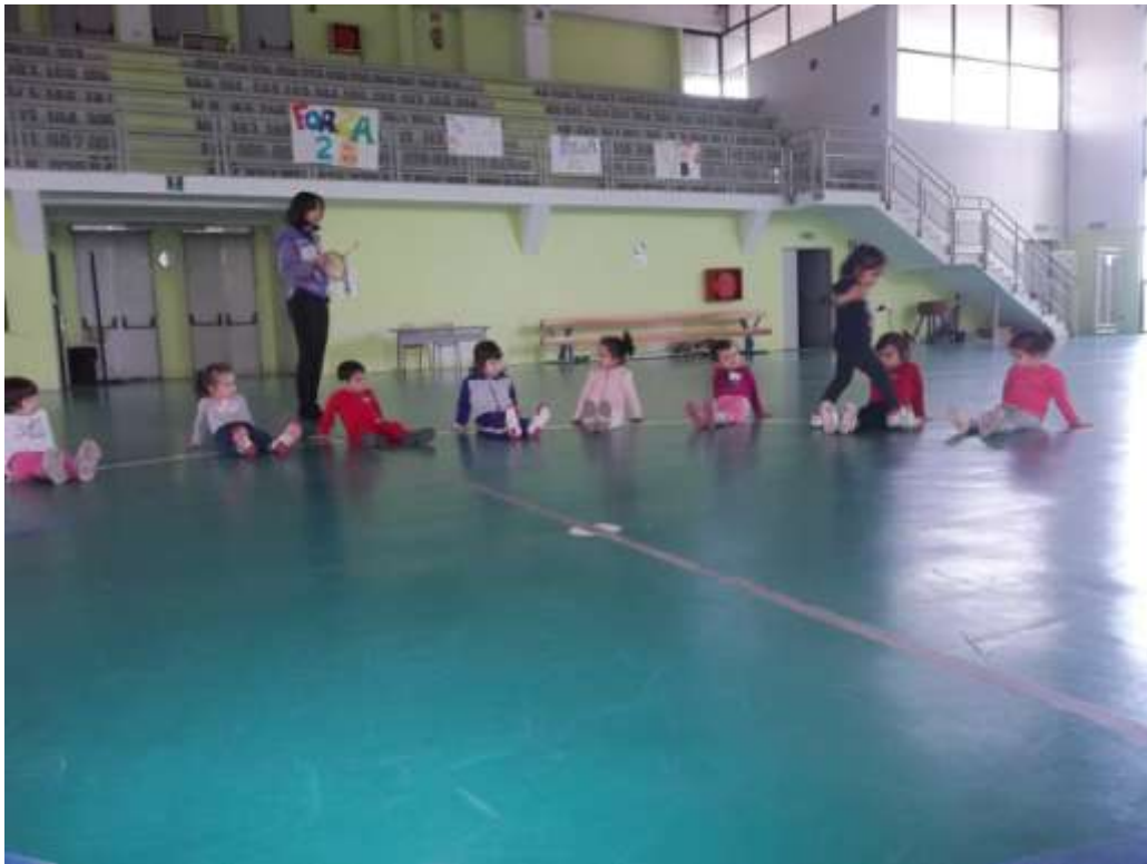
Gli ostacoli siamo noi camminiamo scavalcando "ostacoli"